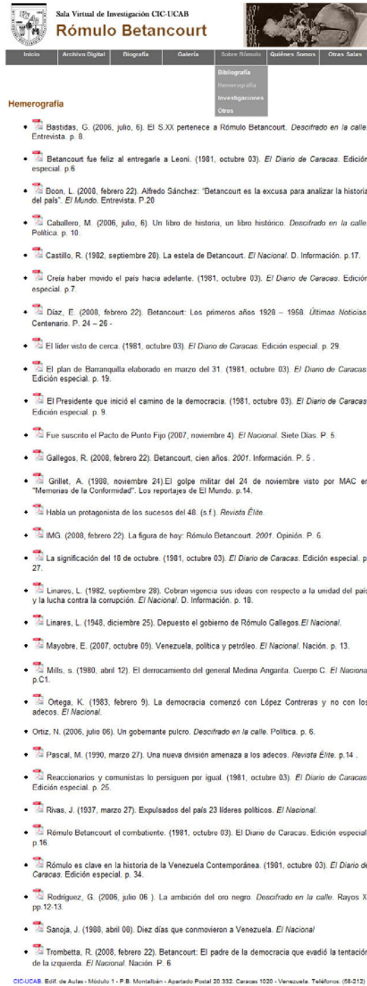
Figura 5: Hemerografía