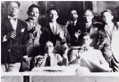
La “Generación del 28”

En febrero de 1928, cuando estudiaba Derecho en la Universidad Central de Venezuela, su nombre aparece entre los dirigentes estudiantiles que se rebelaron contra el régimen del dictador Juan Vicente Gómez durante la Semana del Estudiante. El 14 de ese mismo mes fue apresado en la Cárcel de Puerto Cabello junto con otros tres estudiantes. Posteriormente logra escapar hacia Curazao e inicia su primer exilio.