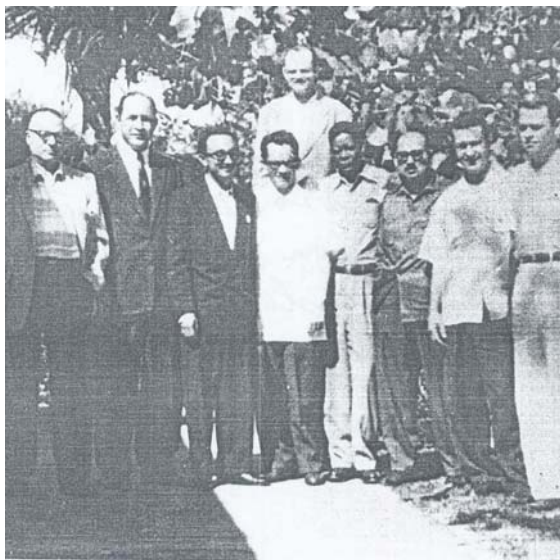
Primera Conferencia de Exilados Políticos de Venezuela.