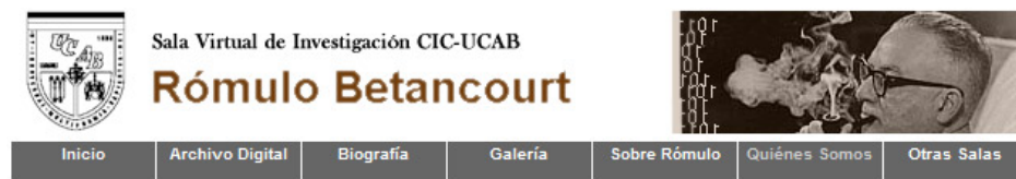
Figura 8: Barra de la Sala Virtual

En Quiénes Somos el usuario puede tener información sobre el equipo de trabajo de la SVI de Betancourt. La sección Otras Salas permite el acceso a las demás Salas Virtuales del CIC. Estas son: Sofía Imber y Carlos Rangel; Miguel Otero Silva; Fotografía Venezolana; Carmen Clemente Travieso; Ramón J. Velásquez; Prensa de la Independencia; Alfredo Jahn Hartman.