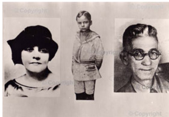
Rómulo Betancourt con sus padres

Su formación académica se inició en una Escuela Taller fundada por el maestro Juan José Fermín. Posteriormente su familia se traslada a la ciudad capital y en 1920 Betancourt ingresa al Liceo Caracas.