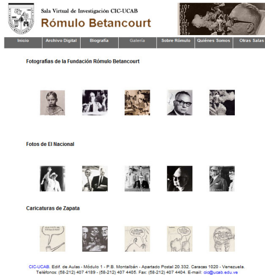
Figura 3: Galería