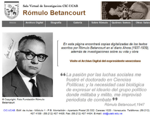
Figura 1: Inicio de la Sala Virtual